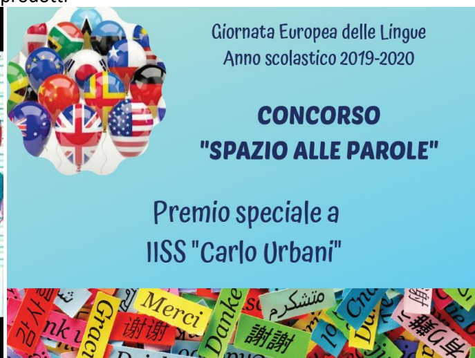
La diretta streaming sul Canale YouTube Spazio allo Spazio e il Premio conferito all'Istituto per la partecipazione